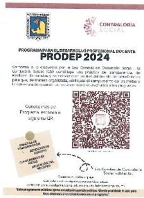
Cartel de difusión